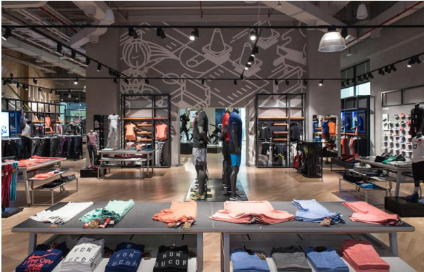
2017_Nike_Mall of Qatar_Zarneshan_170123_0452