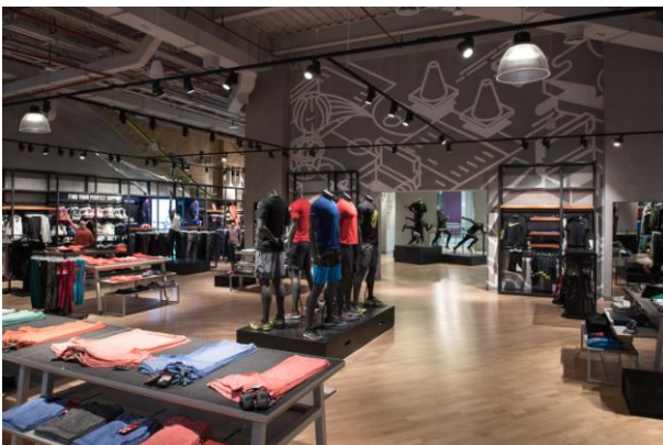
2017_Nike_Mall of Qatar_Zarneshan_170123_0440

Bitte senden Sie uns ein Belegexemplar. Vielen Dank! Ansprechpartner für weiter gehende Informationen: