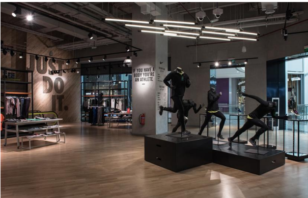
2017_Nike_Mall of Qatar_Zarneshan_170123_0398