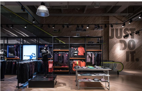
2017_Nike_Mall of Qatar_Zarneshan_170123_0402

Bitte senden Sie uns ein Belegexemplar. Vielen Dank! Ansprechpartner für weiter gehende Informationen: