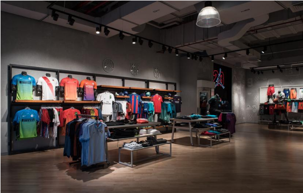
2017_Nike_Mall of Qatar_Zarneshan_170123_0724