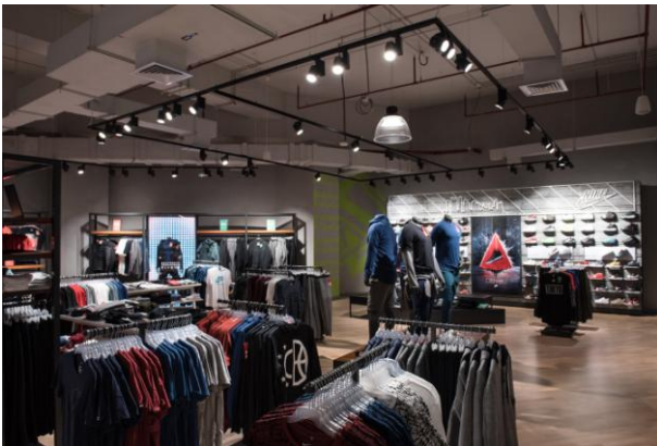
2017_Nike_Mall of Qatar_Zarneshan_170123_0669