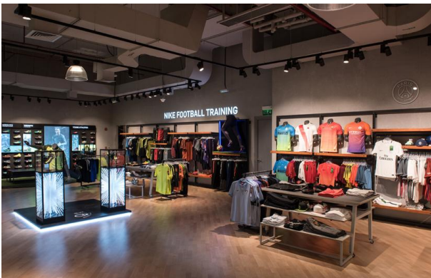
2017_Nike_Mall of Qatar_Zarneshan_170123_0637